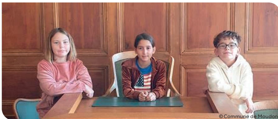
Les élèves qui ont participé à la JOM

À l'occasion de la JOM 2025 (Journée « Oser tous les métiers »), la Commune de Moudon a ouvert ses portes aux élèves des classes de 7 e à 9 e scolaire. Cette année, trois enfants ont pu accompagner leur parent ou proche parent à leur place de travail. Un programme d'activités a été concocté à l'intention des enfants afin qu'ils puissent découvrir les coulisses de la Commune. La journée a démarré avec un petit-déjeuner pour faire le plein d'énergie. Ensuite, chaque enfant a accompagné son parent pour y découvrir les facettes de leur métier. En fin de matinée, une visite des services de l'Hôtel-de-Ville a été organisée. Le temps passant rapidement, il était déjà l'heure de se restaurer avec une bonne pizza. Les estomacs bien remplis, l'Office du tourisme a pris le