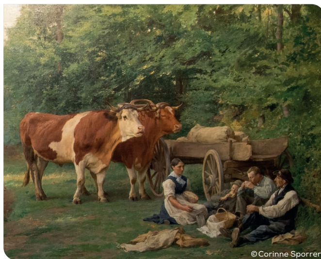
Le Repos des laboureurs