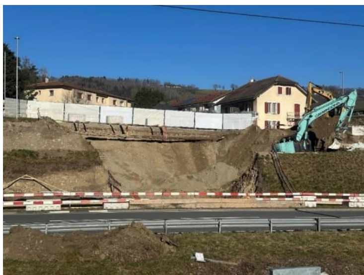
Figure 2 La cellule avant le forage dirigé