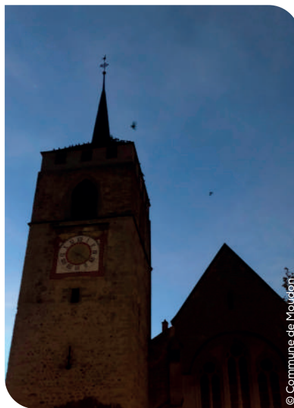
L'église Saint-Etienne n'est plus éclairée

Ces mesures, communiquées le 4 octobre, concernent l'éclairage public, une baisse du chauffage dans les bâtiments communaux et les illuminations de Noël, ainsi que la patinoire. Cette sympathie infrastructure est hélas gourmande en énergie, puisqu'elle consomme l'équivalent de trois ménages durant toute une année. Le traditionnel sapin sur la place du Marché viendra adoucir la fruga-