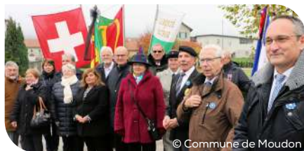
Le président du Conseil communal, la délégation municipale et celle du Souvenir français

C'est désormais une tradition, qui s'inscrit dans les cérémonies du 11 novembre rendant hommage aux soldats de toutes nationalités qui sont morts pour leur patrie au cours des guerres qui ont endeuillés des millions de familles partout dans le monde. Si notre pays a été largement