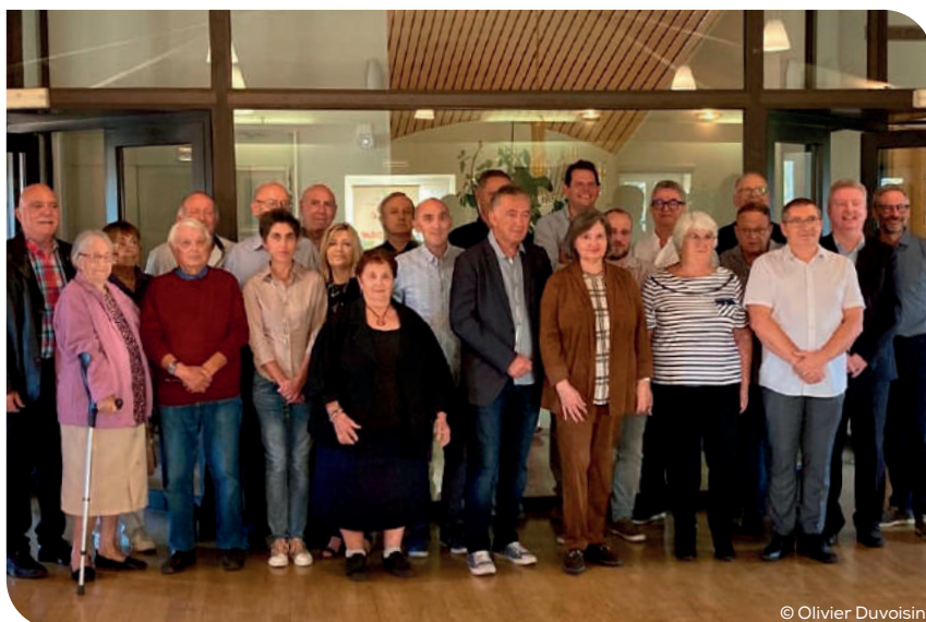
Visite de la Municipalité et du comité de jumelage à Mazan (France) les 24-25 septembre 2022